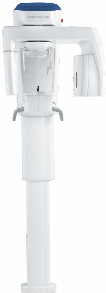
X RADIUS COMPACT 2D/3D